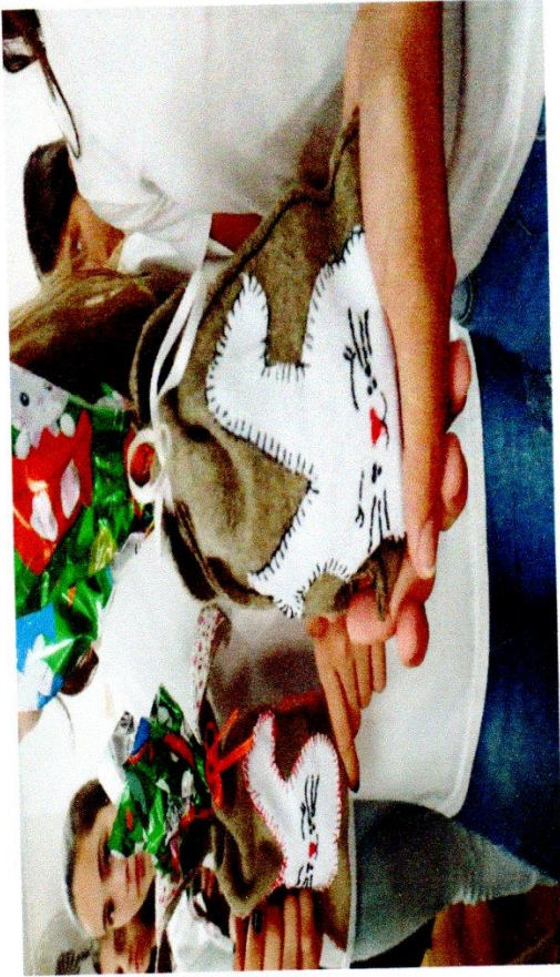
PÁSCOA: DOAÇÕES DE OVOS DE CHOCOLATE E ATIVIDADE LÚDICA